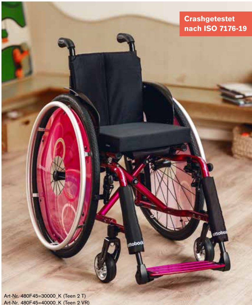
Art-Nr. 480F45=30000_K (Teen 2 T) Art-Nr. 480F45=40000_K (Teen 2 VR)

Faltbarer Aktivrollstuhl für Kinder und Jugendliche