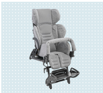
• Kimba Sitzeinheit