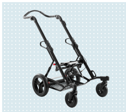
• Kimba Strassengestell

Gemeinsam mit Anwendern, Therapeuten und Ärzten wurde der Kimba Buggy weiterentwickelt und optimiert. Im Fokus standen Sicherheit, Qualität, Individualität und Komfort. Der neue Kimba überzeugt mit einem luftigen Design, zusätzlichen Stauraum und diversen Optimierungen im täglichen Handling. Er bleibt der ideale Begleiter auf dem Weg zum Kindergarten, zum Supermarkt oder unterwegs im Auto.